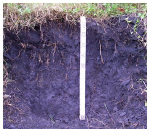
Organossolo Háplico Sáprico distrófico, Suzano-SP, em foto cedida pelo PqC. Marcio Rossi

Organossolos são solos orgânicos, escuros, com presença de muitos restos vegetais não decompostos ou semidecompostos, formados quase que exclusivamente em condições de saturação com água, e, por isso, estão presentes principalmente nas planícies ou várzeas inundáveis. As principais limitações atribuídas aos Organossolos no estado de São Paulo são a elevada frequência de inundação, a acidez excessiva, a presença de sulfetos naqueles na planície costeira. Esses solos têm elevada susceptibilidade à oxidação e perda da matéria orgânica quando é realizada a drenagem para permitir seu uso.